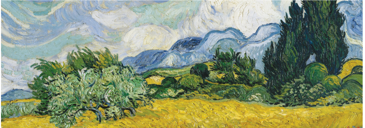
Vincent van Gogh, Champ de blé avec cyprès, 1889.