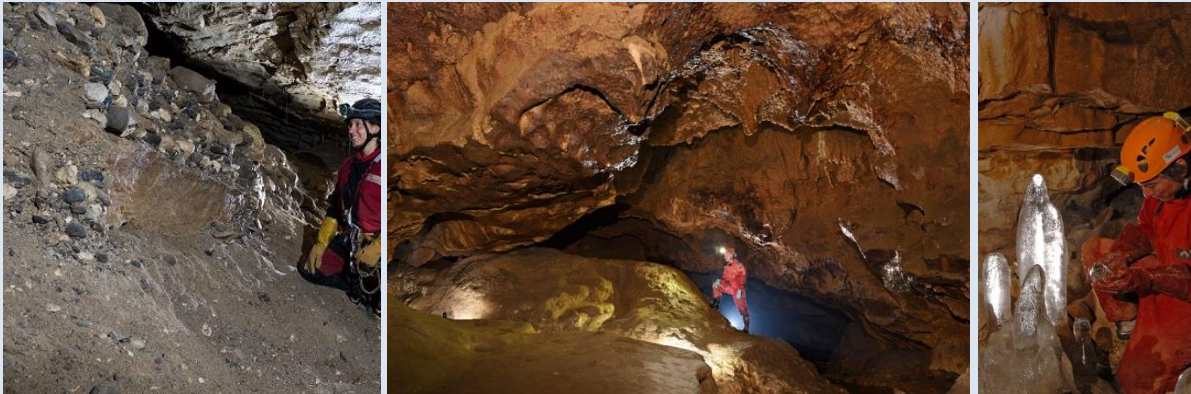
Photo : Grotte de Prér rouge, grotte de Bange, grotte des Elaphes (M. Thomas - Karst 3E, S. Jaillot - Edytem)

Héritages glaciaires, environnement et enregistrement karstique