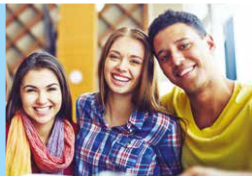
Réalisation : Direction de la communication USMB - décembre 2019 - DOCUMENT NON-CONTRACTUEL