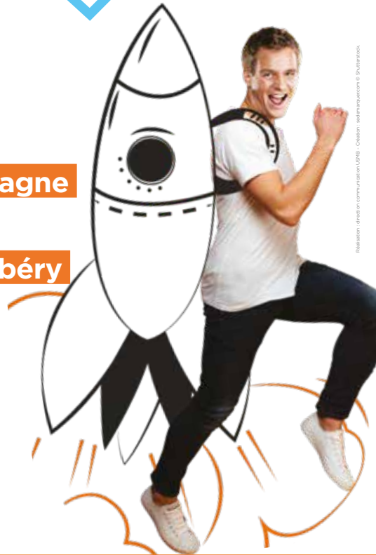
Illustration : direction communication UFRS - Chambéry - www.univ-smb.fr

ANNECY • CHAMBÉRY / JACOB-BELLECOMBETTE • LE BOURGET-DU-LAC